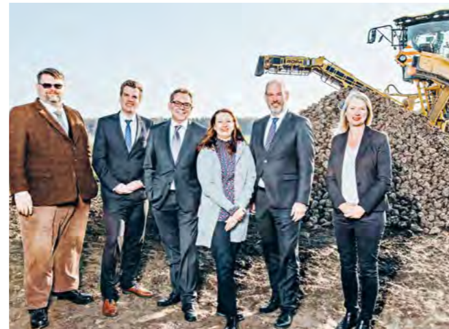
Bei Finanzen ist die Volksbank BraWo der grüne Daumen für Landwirte

Seit vielen Jahrzehnten pflegt die Bank eine enge Zusammenarbeit mit Unternehmen jeder Größe und aus jeder Branche wie z. B. Industrie, Einzelhandel, Bau, Landwirtschaft, Handwerk, Arztpraxen und