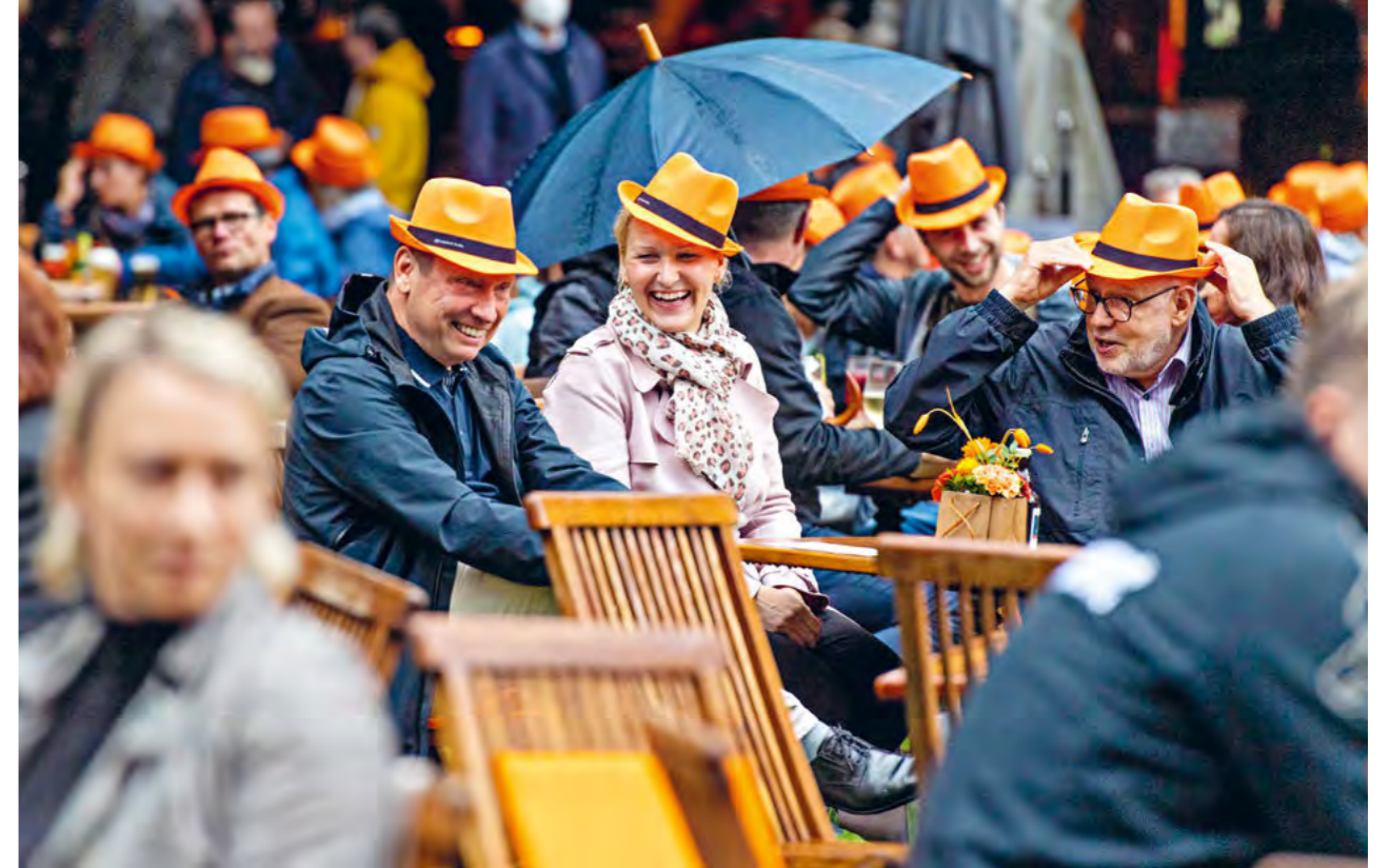
Unter Coronaauflagen konnten die Konzerte im Wolters Applaus Garten (Braunschweig) stattfinden. Die erfreuliche Bilanz trotz erschwelter Bedingungen: 25.000 restlos begeisterte Zuschauer bei 100 Veranstaltungen