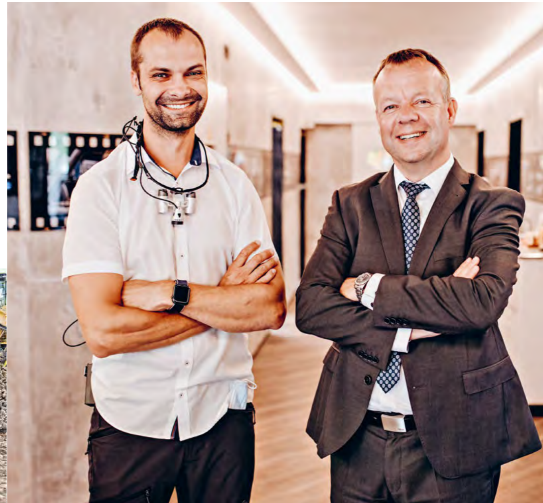
Die Volksbank BraWo verfügt über exzellente Markt- und Branchenkenntnisse im Bereich der Heilberufe. Seit vielen Jahrzehnten begleitet sie Ärzte, Zahnärzte und Apotheker mit ihrem Know-how