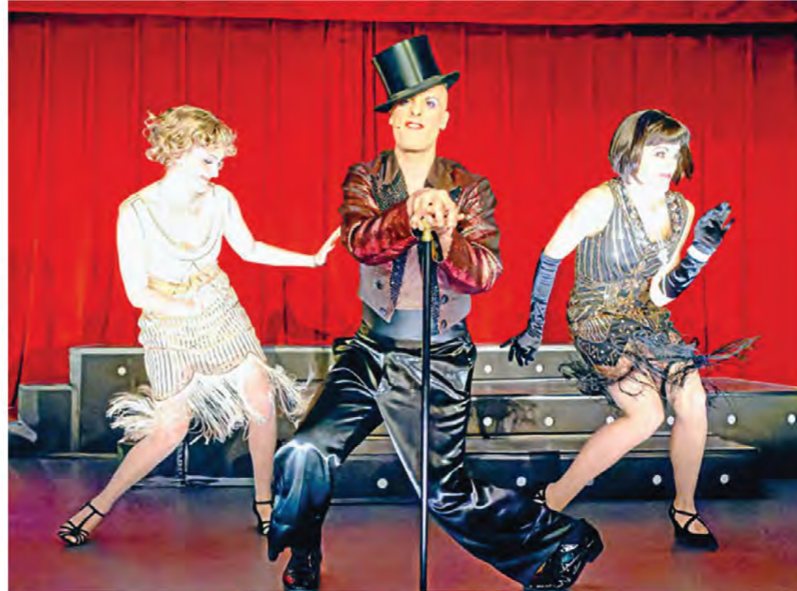
„The Grand Horten – Dinner & Revue“ Vom 19. November bis 19. Dezember 2021 fand im leer stehenden Galeria-Kaufhof-Gebäude in Braunschweig eine hinreißende Revue statt, die die Zuschauer hellauf begeisterte

Bei der Visualisierung der LED-Tafeln an der Medienfassade des Bürohauses „Toblerone“ setzt die Volksbank BraWo auf die