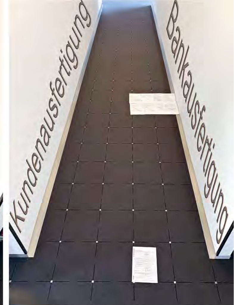
Papier einsparen dient dem Wald- und Klimaschutz: Durch das neue Girokontomodell BraWo-MeinKonto werden rund 150 Blatt Papier pro Kontoeröffnung gespart

Diese Sensibilisierung für den Umwelt- und Klimaschutz erfolgt z. B. über das Projekt „Digitalisierung“. Hier wurde eine Vielzahl von Maßnahmen ergriffen, um Kunden für die intensivere Nutzung von elektronischen Postfächern und Kontoauszügen zu begeistern. Nach einer kurzen Einführungszeit nutzen schon 57 Prozent der Kunden mit Konto das elektronische Postfach aktiv und verzichten damit auf papierhafte Dokumente.