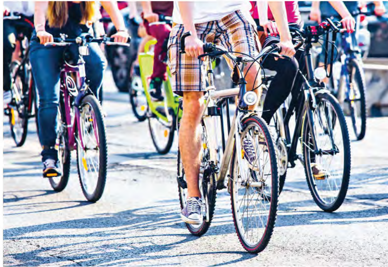
Fahrradfahren für's Klima: 2021 trat auch das BraWo-Fahrradteam für den Klimaschutz kräftig in die Pedale

nem mobilen Arbeitsplatz ausgestattet. Viele digitale Angebote sind bereits erfolgreich etabliert, weitere Innovationen werden sukzessive umgesetzt.