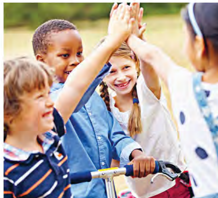
Ziel ist es, Kinder und Jugendliche auf dem Weg zurück in ein unbeschwertes Aufwachsen zu begleiten und sie beim Aufholen von Lernrückständen zu unterstützen

United Kids Foundations wird auch 2022 alles unternehmen, was in ihren Möglichkeiten steht, um Kindern und Jugendlichen sowie deren Familien größtmögliche Unterstützung zukommen zu lassen.