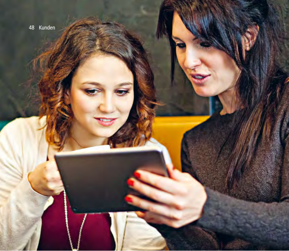
Mit der Einführung von BraWo MeinKonto werden 150 Blatt Papier pro Kontoeröffnung eingespart