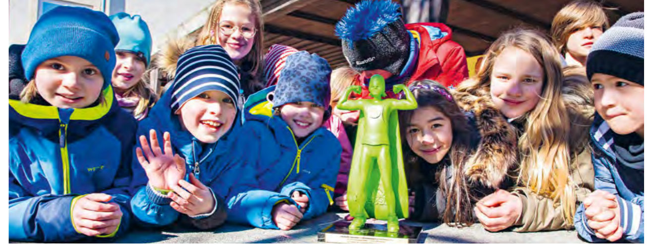
Der step BraWo-Siegerpokal steht für die nächsten Gewinner bereit