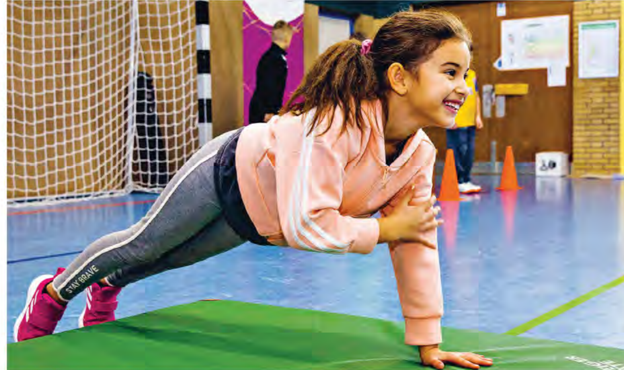
Kinder haben einen Riesenspaß, neue Sportarten zu entdecken

Die Zahlen sprechen für sich: nur noch 58 Prozent der Lehr- und Lernzeit für Kinder- und Jugendliche in der Coronapandemie, dagegen Anstieg der Nutzung von Social Media um 66 Prozent und der Nutzung von Onlinespielen um 75 Prozent. Anstieg der übergewichtigen Kinder im Alter von 10–14 Jahren um 10 Prozent. Steigerung von depressiven Symptomen bei Jugendlichen um 150 Prozent. Anstieg der häuslichen Gewalt gegen Kinder um 9 Prozent.