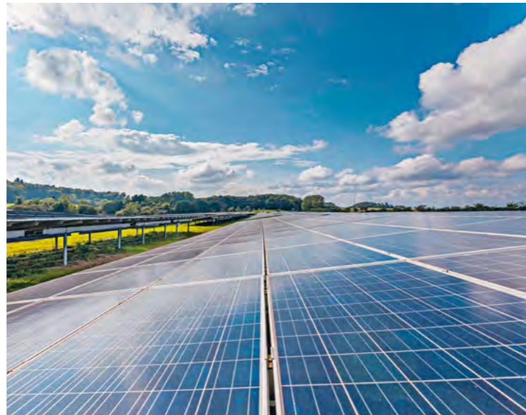
Vorteile von Solarenergie zur Stromerzeugung: Sie ist emissionsfrei, senkt Stromkosten, ein hervorragender Beitrag zu Energiewende und es werden weniger Strommasten benötigt