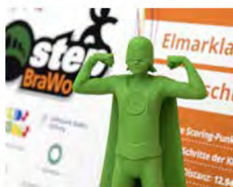
Der Pokal des Gesamtsiegers geht nach Salzgitter.

11.765.217 gesammelte Schritte) krönten sich die Renntiger der Grundschule Isenbüttel zum Champion in Gifhorn.