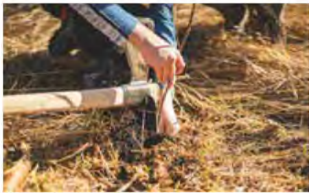
Aufforsten für einen gesunden Mischwald im Harz.