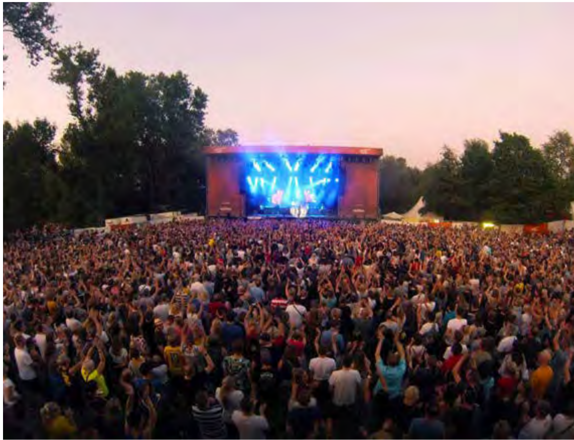
Open-Air-Spektakel und eine volle Halle: So stellen wir uns den Veranstaltungssommer 2022 vor.

Bereits gekaufte Tickets behalten selbstverständlich für die Ersatztermine ihre Gültigkeit.