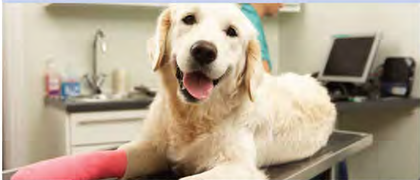
Wenn Ihr Hund sich verletzt, kann das teuer werden. Sorgen Sie mit einer Hunderversicherung vor.