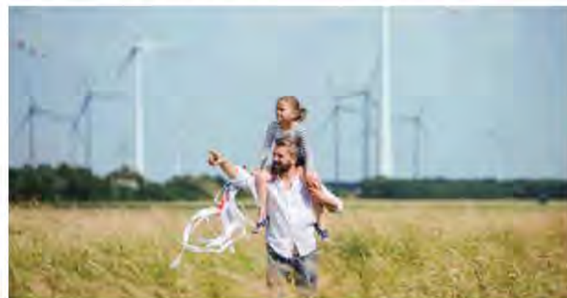
Investieren in eine nachhaltige Zukunft lohnt sich immer – auch finanziell.

Stellen Sie die richtigen Weichen für Ihre nachhaltige, finanzielle Zukunft und lassen Sie sich unter www.volksbank-brawo.de/privatkunden/von-unseren-Experten-beraten .