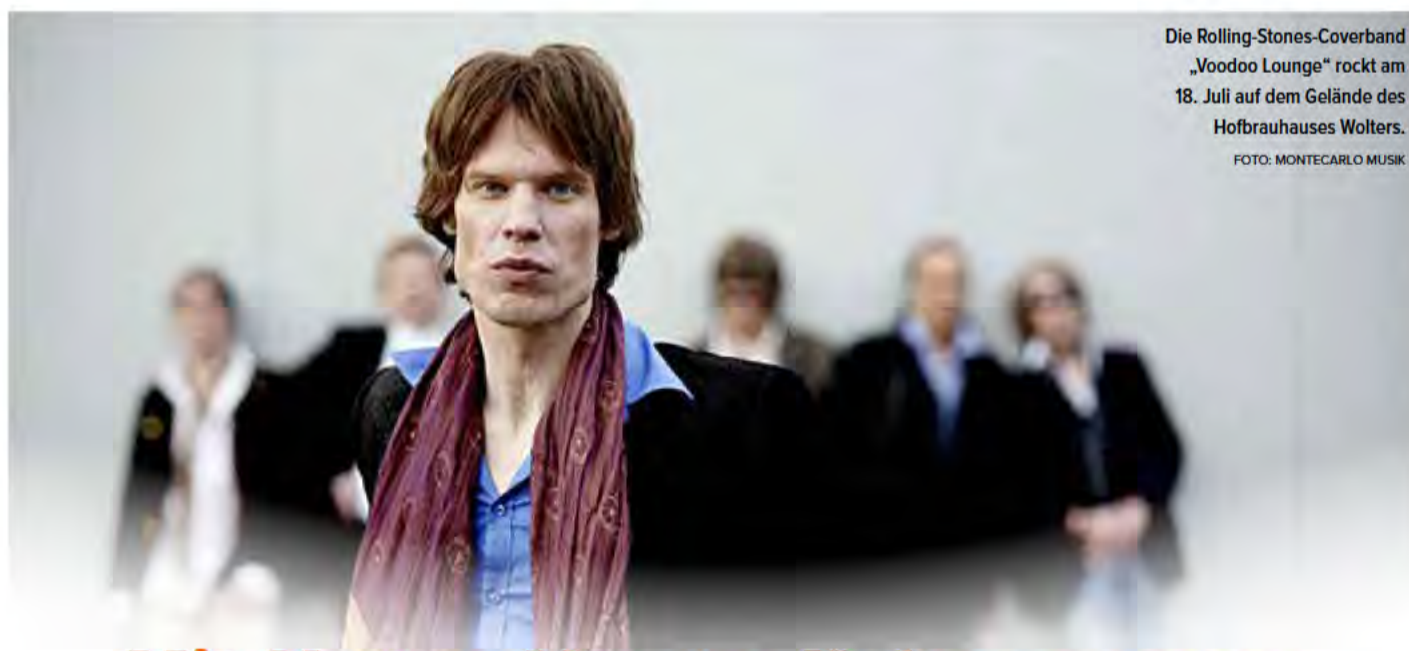
Die Rolling-Stones-Coverband „Voodoo Lounge“ rockt am 18. Juli auf dem Gelände des Hofbrauhauses Wolters.

25.000 junge Sprösslinge für einen gesunden Mischwald. Impressionen der Pflanzaktion und weitere Informationen zum United Kids Foundations Wald finden Sie auf SEITE 5.